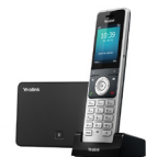
W56P (Cordless Phone)